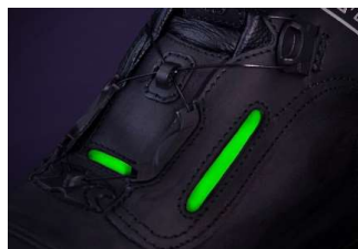
Safety Light Element

EWS „DIE SCHUHFABRIK“ e.K. Klosterstraße 18 D-06295 Lutherstadt Eisleben